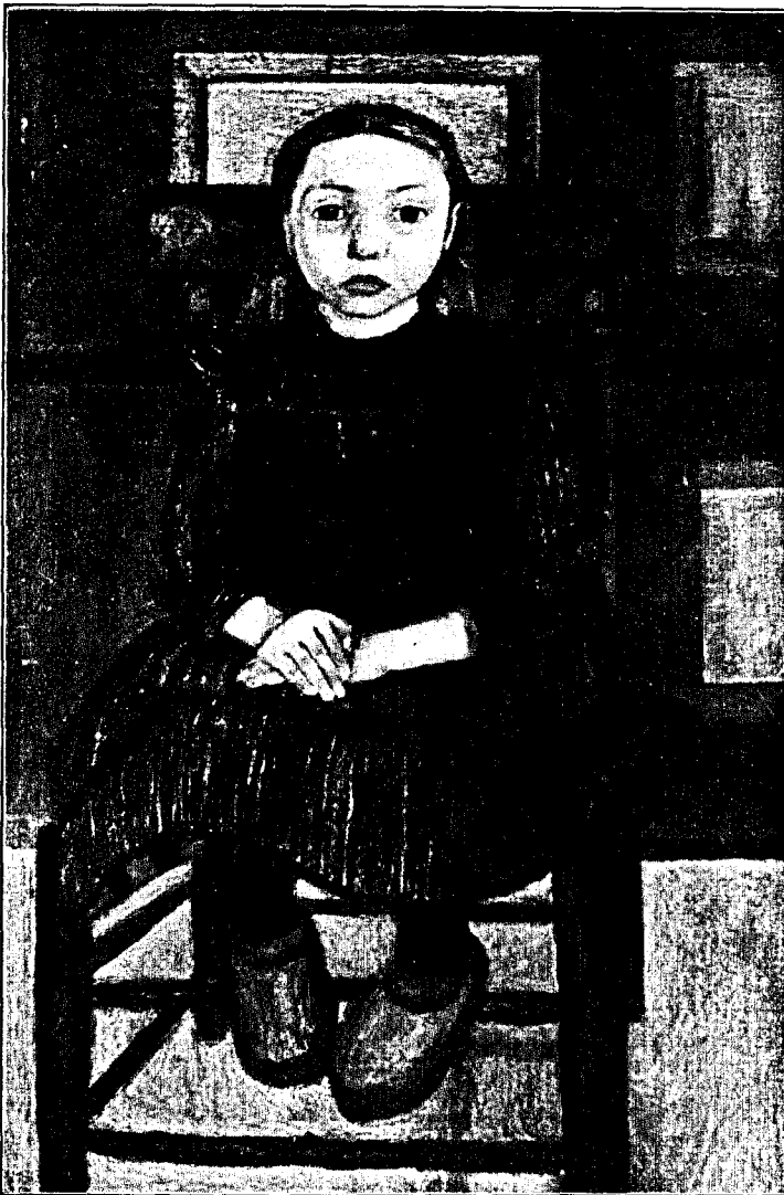
Bauernkind auf einem Stuhl sitzend. Gemälde. Bremen, Kunsthalle

Zauber dieses prachtvoll reinen Menschen vor ihre Bilder, und man wird fühlen, daß in dieser Frau Größe war und daß sich in ihr ein Schicksal verkörpert, von dem wir alle — zumal in dieser Zeit der Prüfungen — unendlich lernen können.