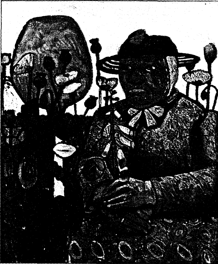
Bauersfrau im Blumengarten. Gemälde. Bremen, Kunsthalle

Ewigkeit her bestimmte Dasein dieser Moorbauern ähnlich groß im Geiste des rein Menschlichen gestaltet? Doch nicht die sogenannten Worsweder, die aus diesem Stück norddeutschen Bodens letzten Endes eine literarische Angelegenheit gemacht haben. Doch nicht Cézanne, der genau so mit dem Verstande konstruierte, wie Paula Moderjohn mit dem Gefühl ergreift. Nein, dieser einfachen, stillen Kunst tut man im letzten bitter unrecht, wenn man für sie überhaupt irgendwie kunstgeschichtliche Parallelen sucht. Sie ist das und nicht mehr und nicht weniger, als was sie diese Frau selbst in ihren Briefen angesprochen hat, Summe des Gefühls, mit der ein Gegenstand