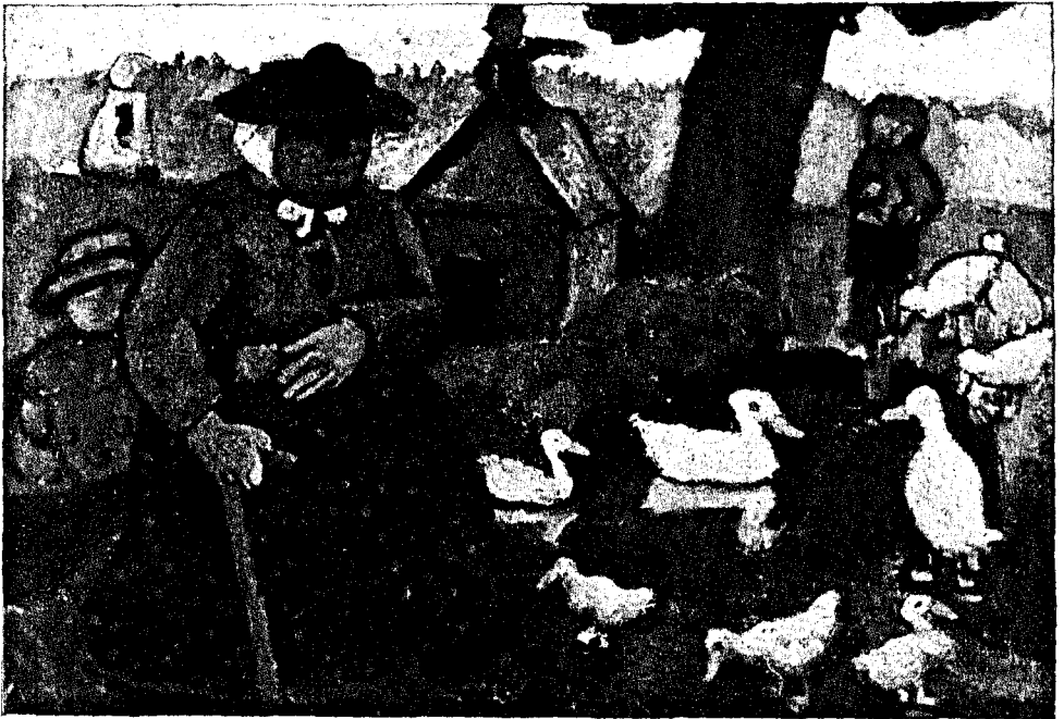
Die Bäuerin mit Enten. Gemälde. Im Besitze von Otto Moderfohn, Fischerhude 31 a