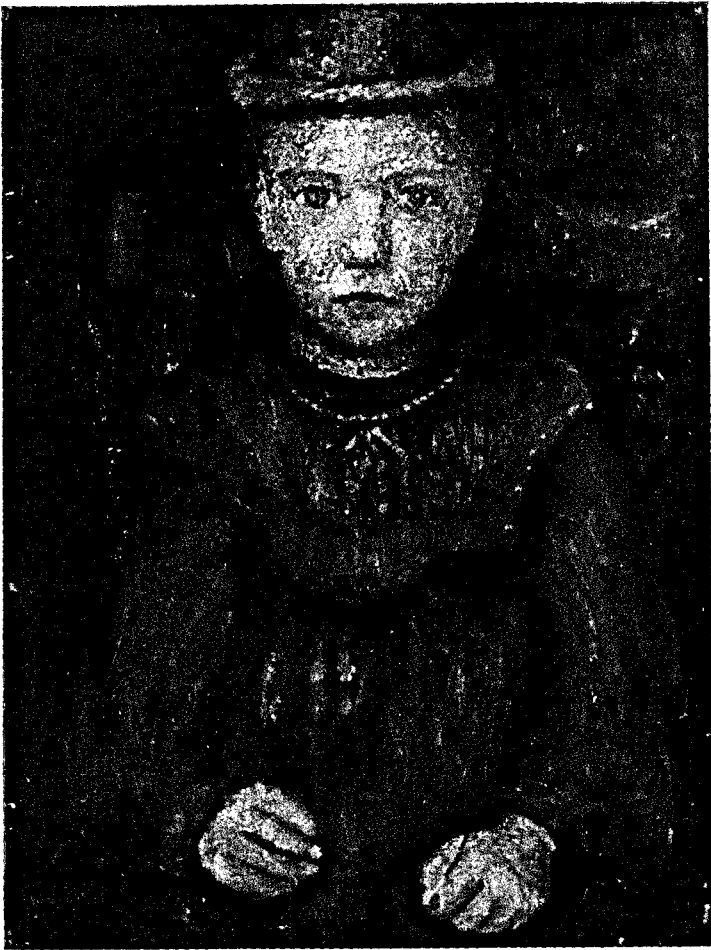
Mädchen mit grüner Kette. Gemälde um 1904 Im Besitze von Otto Modersohn, Fischerhude

finden, an und für sich; aber ich konnte kein Band finden von ihr zur modernen Kunst. Und nun habe ich es gefunden, und das heißt, glaube ich, ein Fortschritt. Ich fühle eine innere Verwandtschaft von der Antike zur Gotik, hauptsächlich die frühe Antike, und von der Gotik zu meinem Formempfinden.