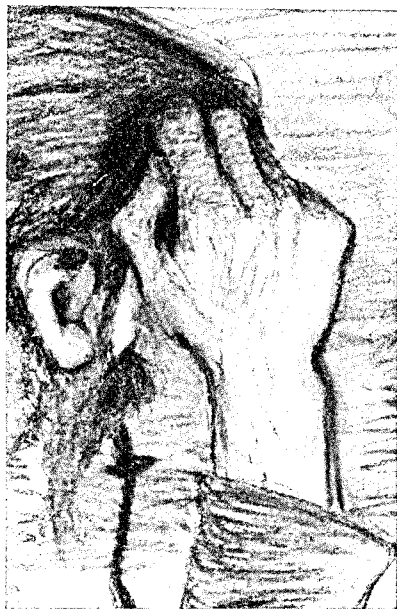
Studie nach einer Hand

zählen als viele Dutzende jener glatten Porträts sogenannter Modemaler. Mag sein, daß diese Ehrlichkeit und Zensseitigkeit der Gesichte heute noch dem Geschmack der Zeit weniger liegt. Einmal wird man bestimmt diese Dinge lieben, wie man Cranach und Grünwaldt liebt, und wer sich erst ganz in diese Kunst hineingesehen hat, dem geht sie wie von selbst auf als etwas, das beinahe schicksalhaft im schweren Hintergrund dieser unserer Zeit und unseres Volkes verankert liegt. Man muß nur den Willen haben, die Schönheit nicht außerhalb der Kunst zu suchen, d. h. in dem billigen Drum und Dran der Effekte und darf nicht nur in der „Peinture“ an sich, die immerzu der einzige Maßstab der Franzosen ist und die zu unserem so völlig anders gear-