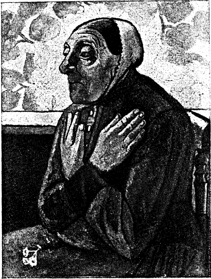
Alte Bäuerin mit über der Brust gekreuzten Händen. Gemälde. 1906—1907 Hamburg, Kunsthalle