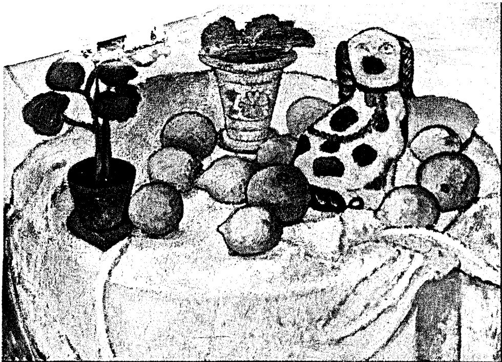
Stilleben mit Porzellanhund. Gemälde 1907. Bremen, Kunsthalle