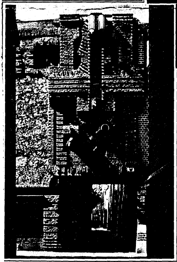
Das Bremer Wappen am Paula Becker-Modersohn- Haus